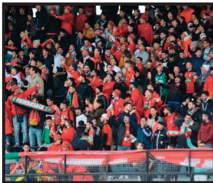
à un grand nettoyage.»

Pour la majorité des supporters, le staff technique, les joueurs et les dirigeants actuels n'ont pas été à la hauteur et ont échoué sur tous les plans. «Ça y est, cela ne peut plus continuer. Le club se retrouve dans une situation catastrophique et ces pseudo-responsables sont restés les bras croisés. Ils étaient capables de bâtir une grande équipe mais par incompétence, ils ont totalement échoué. Maintenant, les dirigeants ont l'audace de persister dans leur mensonge et tout faire pour rester au club. Ils ont osé donner de faux espoirs aux supporters. Nous ne comptons pas nous taire et nous sommes décidés aujourd'hui à dénoncer sa gestion et les pousser à quitter le club. On ne compte pas cautionner cette anarchie et on ira plus loin afin de procéder